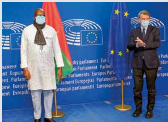
Le président du Faso s'est entretenu, le 9 février 2021, avec le président du Parlement européen, David Sassoli