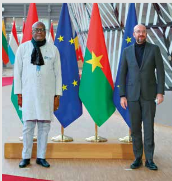
Avant de quitter Bruxelles pour Paris, le président du Faso s'est entretenu, le 9 février, avec le président du Conseil européen, Charles Michel