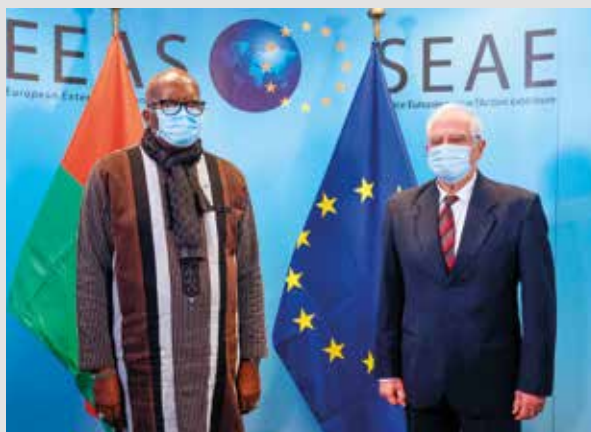
Roch Marc Christian Kaboré a échangé avec le Haut représentant de l'Union européenne pour les Affaires étrangères et la Politique de sécurité, Joseph Borrell