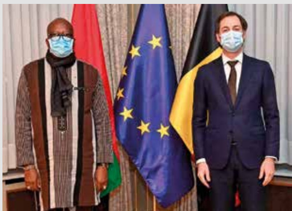
Le chef de l'État a eu une séance de travail avec le Premier ministre du Royaume de Belgique, Alexander De Croo