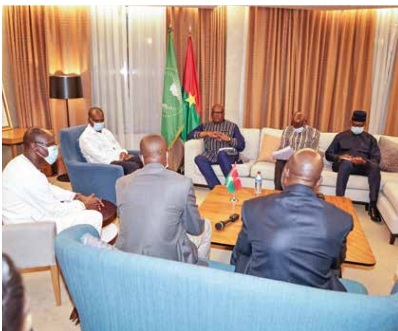
La communauté burkinabè du Congo a exprimé des préoccupations relatives, entre autres, aux conditions de séjour