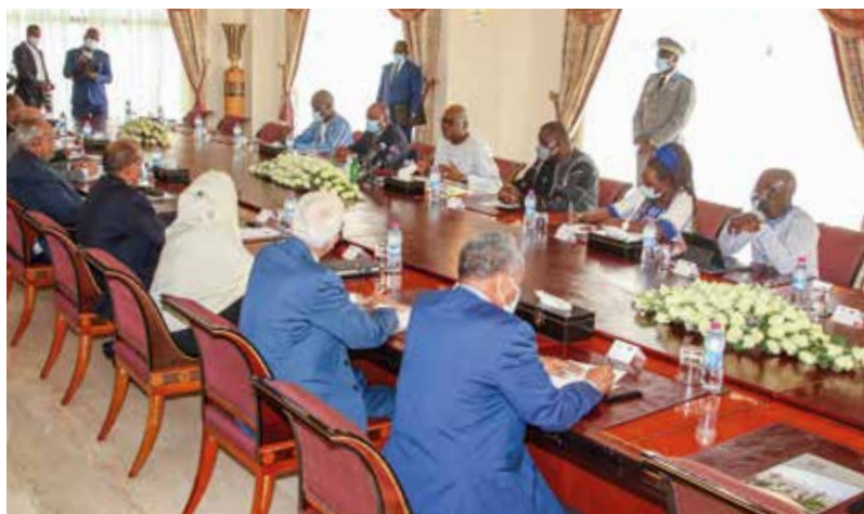
Le président du Faso, Roch Marc Christian Kaboré en séance de travail avec son homologue Ismaïl Omar Guelleh

Le président du Faso, Roch Marc Christian Kaboré, a effectué une visite officielle de 72 heures à Djibouti du 26 au 28 janvier 2021. Dans ce pays situé dans la corne de l'Afrique, le président a eu une séance de travail avec son homologue Ismaïl Omar Guelleh avant de s'adresser aux députés djiboutiens.