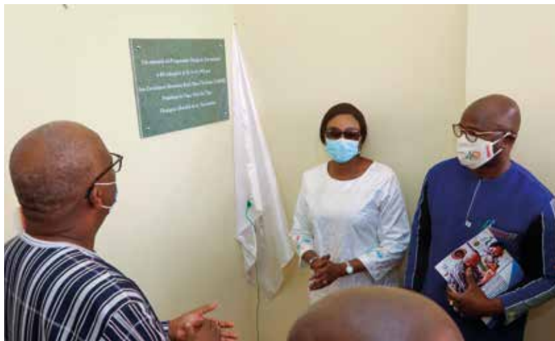
Le président du Faso dévoile la plaque, inaugurant ainsi le nouvel entrepôt.

La célébration de ce 40 e anniversaire a également été marquée par l'inauguration du nouvel entrepôt du PEV qui va garantir la disponibilité des vaccins.