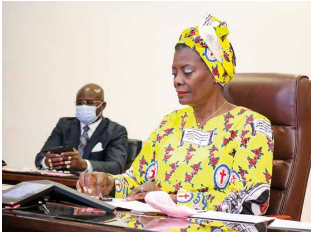
L'épouse du président du Faso, Mme Sika Kaboré se bat depuis plus de 16 ans contre les cancers féminins à travers la fondation KIMI

L'épouse du président du Faso, Mme Sika Kaboré, a participé, le lundi 25 février 2021, par visioconférence à une réunion de l'Union européenne sur le thème : « Éliminer ensemble le cancer du col de l'utérus ».