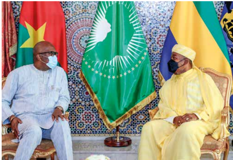
Les deux chefs d'État ont passé en revue l'état de la coopération entre leur pays

Les deux chefs d'État ont donné des instructions à leurs ministres en charge des Affaires étrangères, de se mettre à la tâche, pour dégager les priorités dans lesquelles le Burkina Faso et le Gabon pourraient s'engager, dans le cadre de la Zone de libre-échange continentale africaine.