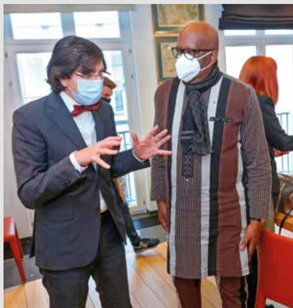
Le président du Faso, Roch Marc Christian Kaboré, s'est entretenu, le 8 février 2021 avec le ministre-président de Wallonie, Elio Di Rupo