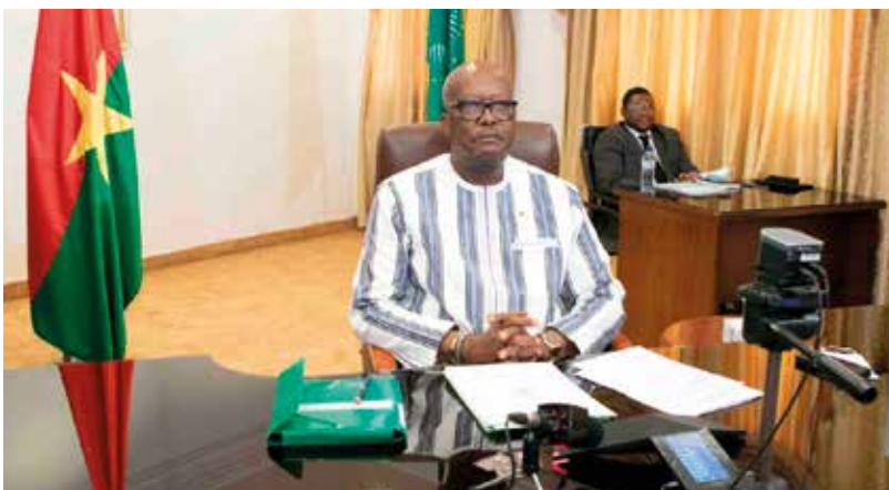
Au cours de cette rencontre virtuelle, Roch Marc Christian Kaboré et ses pairs ont procédé au renouvellement des instances de l'UA.

Roch Marc Christian Kaboré et ses pairs ont aussi renouvelé leur confiance à Moussa Faki Mahamat, au poste de président de la commission de l'Union africaine, selon le chef de la diplomatie burkinabè. Pour Alpha Barry, des commissaires ont également été élus