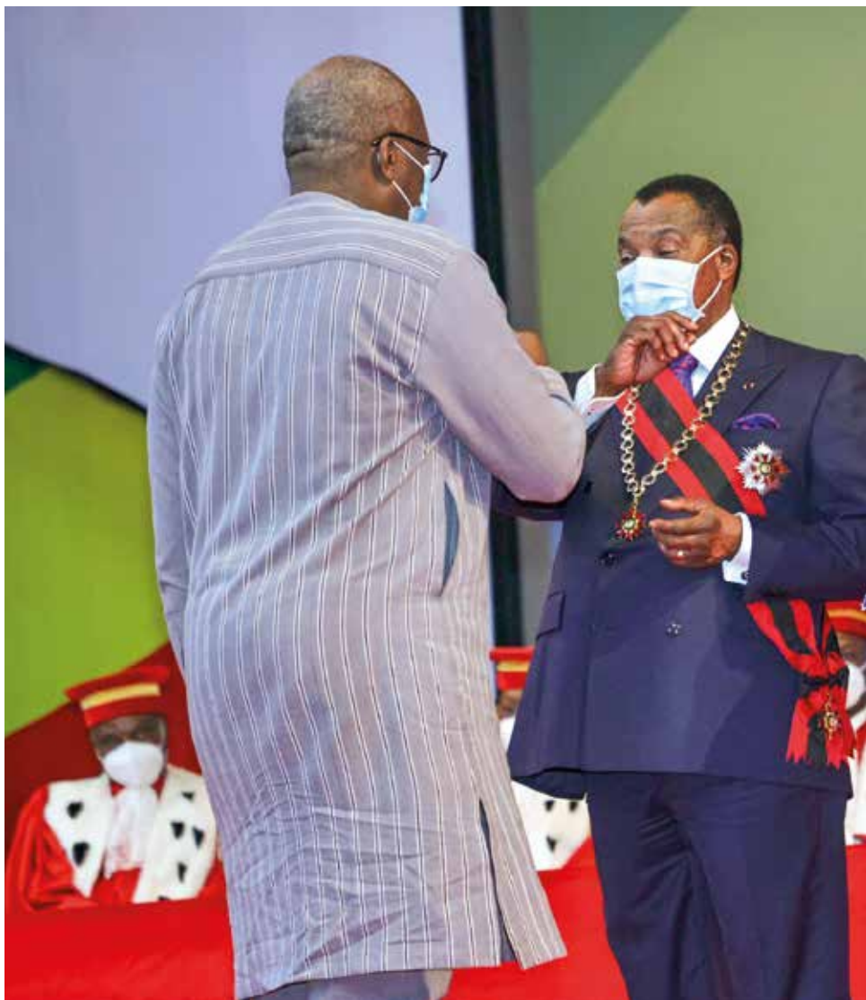
Le président du Faso, Roch Marc Christian Kaboré, a félicité son homologue congolais pour sa réélection et lui a souhaité plein succès pour son nouveau mandat

Fidèle à ses habitudes, lors de ses déplacements à l'étranger, le président du Faso Roch Marc Christian Kaboré a échangé également avec une délégation de la communauté burkinabè vivant au Congo.