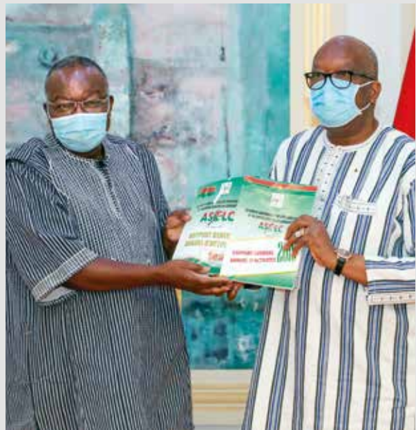
Le président du Faso, Roch Marc Christian Kaboré, a reçu, le lundi 18 janvier 2021, les rapports d'activités 2018 et 2019 de l'Autorité supérieure de contrôle d'État et de lutte contre la corruption (ASCE-LC).