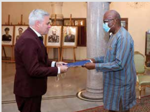
L'ambassadeur d'Israël, Léo Vinovezky réside à Abidjan en Côte d'Ivoire