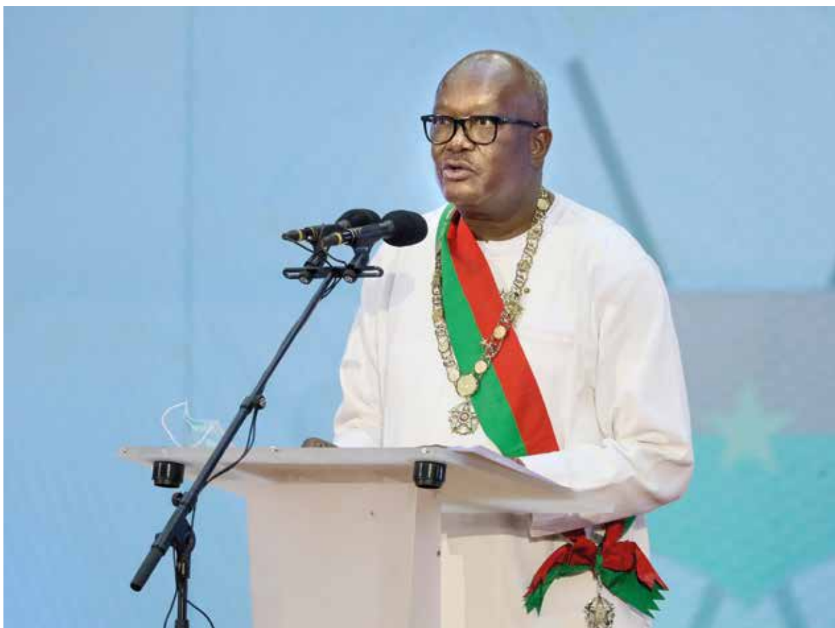
Le président du Faso, Roch Marc Christian Kaboré, a appelé tous les Burkinabè à l'union sacrée

personnalités, Représentants des Chefs d'État de l'Afrique du Sud, de l'Angola, du Bénin, du Cameroun, de l'Union des Comores, du Congo, du Royaume d'Arabie Saoudite, de l'Égypte, des États-Unis, de la France, du Gabon, de la Gambie, du Kenya, du Koweït, du Liban, du Nigeria, et du Rwanda. J'exprime ma gratitude aux Présidents de la Commission de l'Union africaine, de la CE-DEAO, de l'UEMOA ainsi qu'au Représentant du Secrétaire