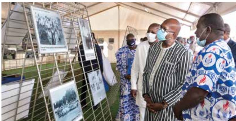
Roch Marc Christian Kaboré a visité l'exposition photographique retraçant l'histoire des Assemblées de Dieu.

Au cours de la cérémonie, plusieurs personnalités physiques et morales ont été décorées.