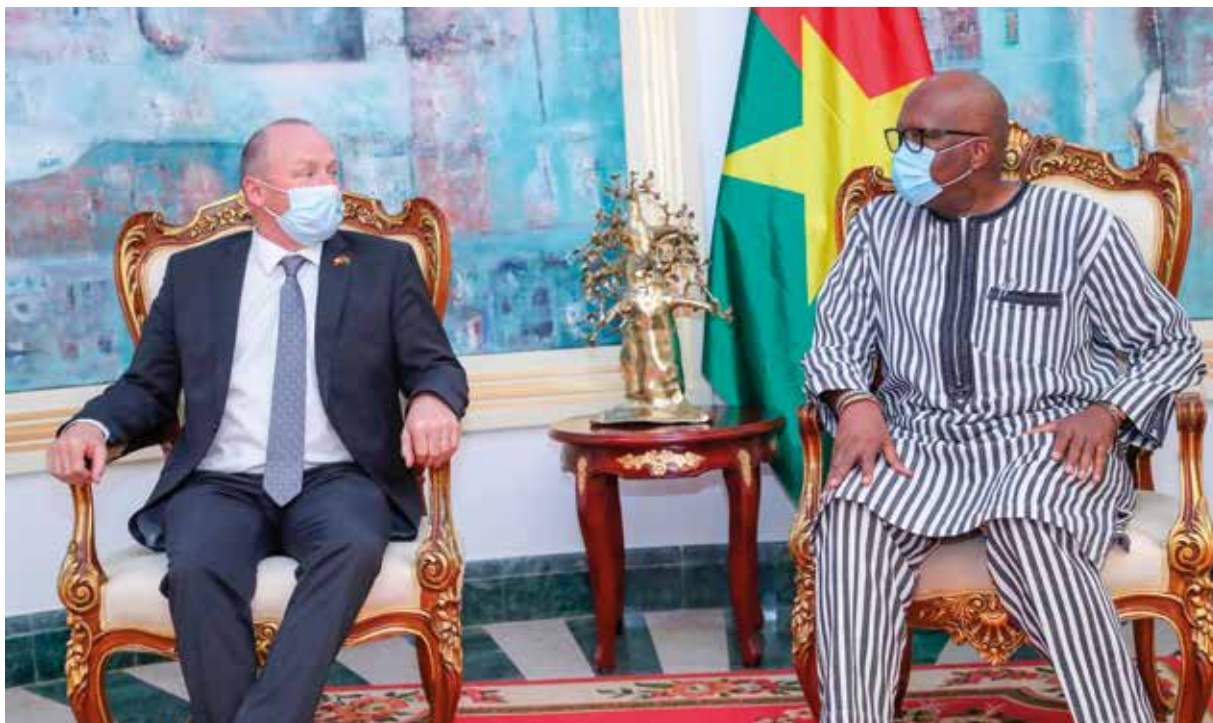
Le président du Conseil national de la Confédération suisse a fait au président du Faso, le point de sa mission au Burkina Faso