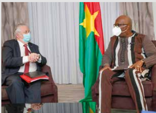
Séance de travail du président du Faso avec le président honoraire du Parlement belge et ministre d'État, André Flahaut.