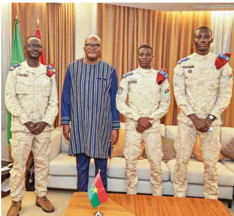
Avec les militaires stagiaires, Roch Marc Christian Kaboré s'est réjoui de la diversification des horizons de formation des cadres militaires burkinabè