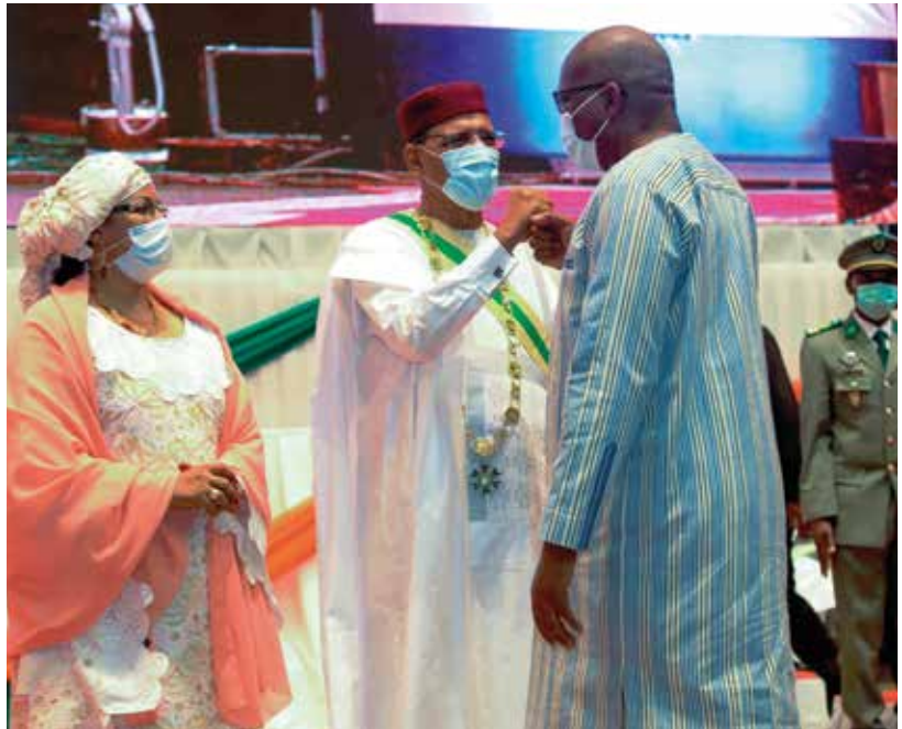
Le président du Faso, Roch Marc Christian Kaboré, félicitant le nouveau président du Niger Mohamed Bazoum

Le président du Faso, Roch Marc Christian Kaboré, a pris part, le vendredi 2 avril 2021 à Niamey, à la cérémonie d'investiture du président de la République du Niger, Mohamed Bazoum. Il a été élu avec 55,75 % des voix à l'issue du second tour du scrutin, organisé le 21 février 2021.