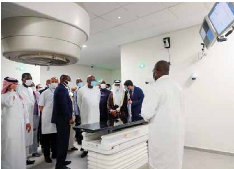
Le président du Faso, Roch Marc Christian Kaboré et l'envoyé spécial, Hamad Bin Nasser Bin Jassim Al Thani visitant les locaux du Centre de radiothérapie de Bogodogo.

Le président du Faso, Roch Marc Christian Kaboré, a inauguré, le vendredi 9 avril 2021 à Ouagadougou, le Centre de radiothérapie de Bogodogo, d'une capacité de prise en charge de 1 500 patients par an.