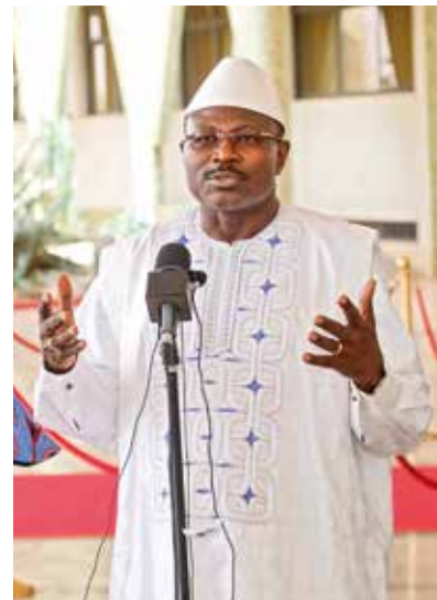
Le Chef de file de l'opposition politique, Eddie Komboïgo a été rassuré de l'avancée sur certaines questions