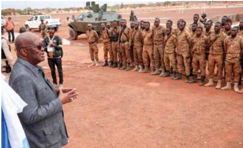
Roch Marc Christian Kaboré : « Nous sommes toujours debout et nous nous battons pour que les problèmes soient résolus. »

Roch Marc Christian Kaboré, a rencontré des Hommes déterminés et prêts au sacrifice pour la patrie. Il a salué leur courage, leur engagement, leur esprit de discipline et de cohésion. Il a rappelé que leur sacrifice sur le terrain de la lutte contre le terrorisme nécessite l'accompagnement de tous.