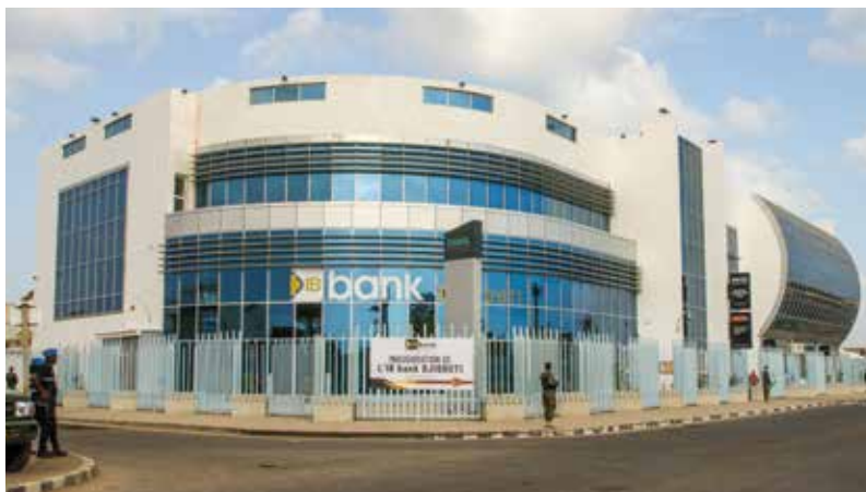
Les présidents burkinabè, Roch Marc Christian Kaboré et djiboutien, Ismail Omar Guelleh ont inauguré la succursale de International Business Bank (IB Bank).