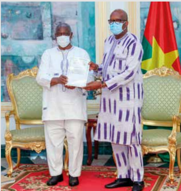
Le président du Faso, Roch Marc Christian Kaboré, a reçu, le mardi 23 février 2021, le rapport public 2020 du Conseil économique et social (CES).