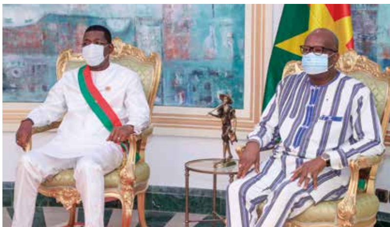
Alassane Bala Sakandé a recueilli des conseils du président du Faso, au regard de son expérience

Le chef du parlement a également sollicité du président du Faso, des conseils en tant qu'ancien président de l'Assemblée nationale pendant une décennie.