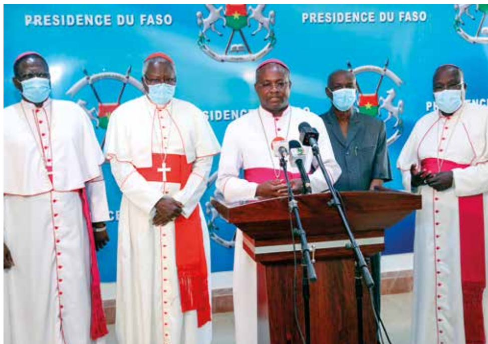
La conférence épiscopale Burkina-Niger, reçue en audience le 15 janvier 2021, a rassuré le chef de l'État de ses prières pour la réussite de son deuxième mandat.

Le président du Faso, Roch Marc Christian Kaboré a reçu, dès l'entame de son mandat, le soutien des leaders coutumiers et religieux pour un mandat de paix et de cohésion sociale. Le chef de l'État a reçu respectivement en audience la Conférence épiscopale Burkina-Niger le 15 janvier 2021, les chefs coutumiers, le 13 février 2021 et la Fédération des associations islamiques du Burkina le 2 mars 2021.