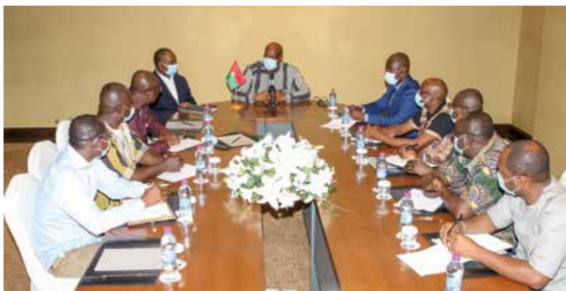
Les Burkinabè vivant à Djibouti ont eu une rencontre avec leur président