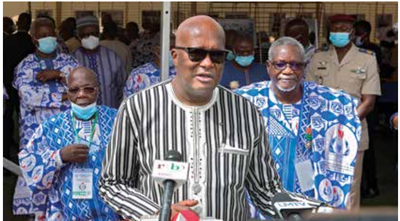
Le président du Faso, Roch Marc Christian Kaboré, a salué la participation des Assemblées de Dieu au développement du Burkina Faso

Le président du Faso, Roch Marc Christian Kaboré a participé, le dimanche 14 mars 2021 à Ouagadougou, au culte de clôture des activités de célébration du centenaire des églises des Assemblées de Dieu du Burkina Faso.