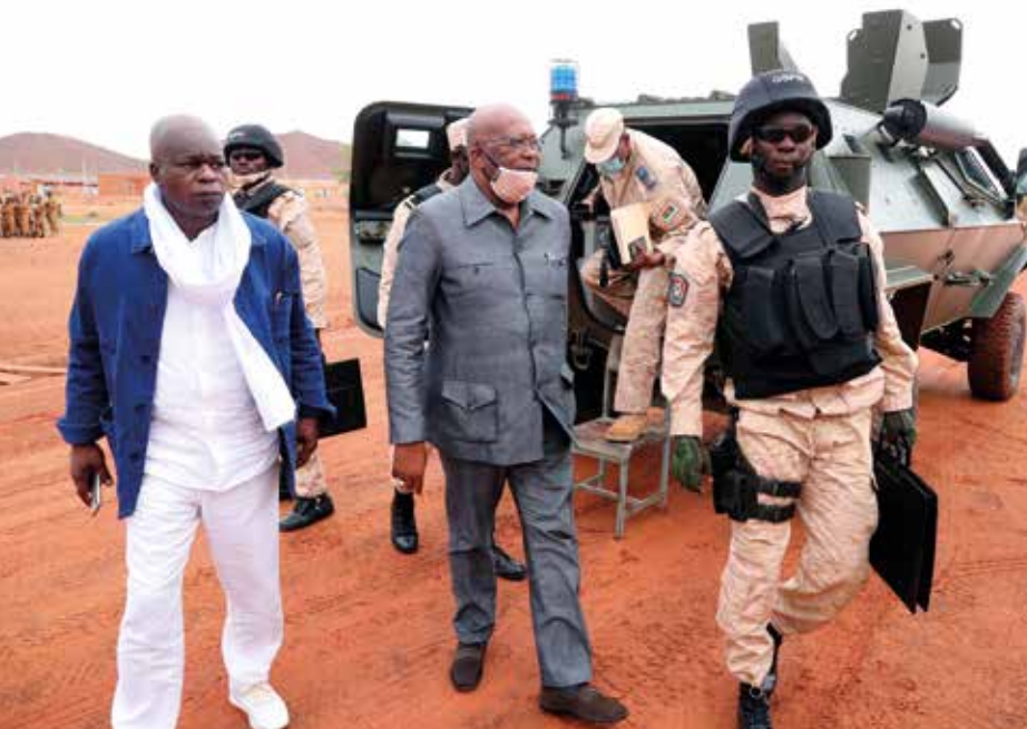
Lors de sa visite à Djibo, le 18 juin 2020, le président du Faso a rappelé la nécessité de l'union de tous les Burkinabè contre le terrorisme

In “ Roch Marc Christian Kaboré Mon programme 2021-2025 ”