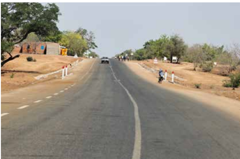
Finis la poussière et autres désagréments pour se rendre à Ouagadougou

Le président du Faso, Roch Marc Christian Kaboré, a procédé, le samedi 24 avril 2021, à Gon-Boussougou, à l'inauguration de la route nationale 29 (RN 29), Manga-Zabré. Les travaux de bitumage de cette route, longue de 79 kilomètres, ont coûté environ 29 milliards FCFA.