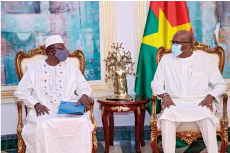
Le président du Faso et son hôte ont échangé sur les grands enjeux de la Nation

Le président du Faso, Roch Marc Christian Kaboré, a reçu en audience, le vendredi 12 mars 2021, le Chef de file de l'opposition politique (CFOP), Eddie Komboïgo, venu échanger avec le chef de l'État sur les grandes questions qui touchent la vie de la Nation.