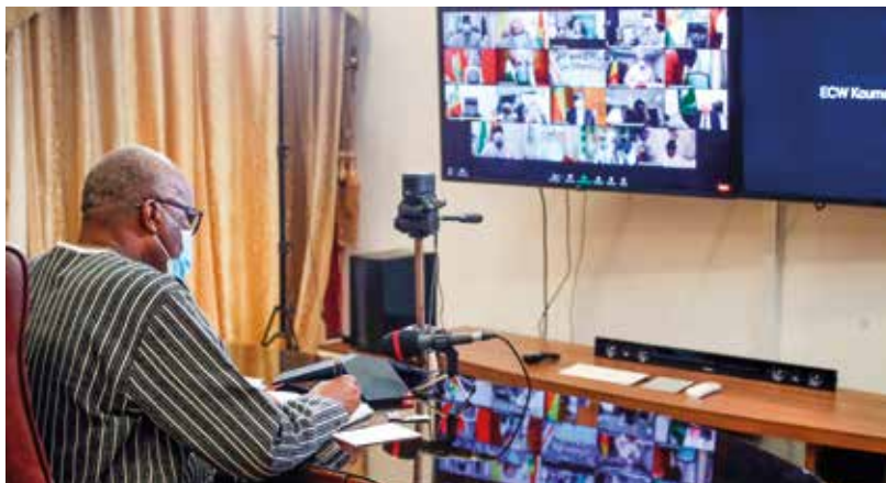
Les chefs d'État ont échangé sur l'accès au vaccin contre la COVID 19, la monnaie unique l'Eco, et les questions sécuritaires

Selon le chef de la diplomatie burkinabè, les chefs d'État ont planché sur la transition politique au Mali. Un exposé sur l'évolution de la situation a été présenté par le médiateur désigné de la CEDEAO pour la crise malienne, l'ancien président nigérian Goodluck Jonathan.