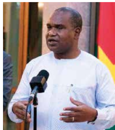
Le ministre Alpha Barry au cours de son point de presse, à l'issue de la visioconférence