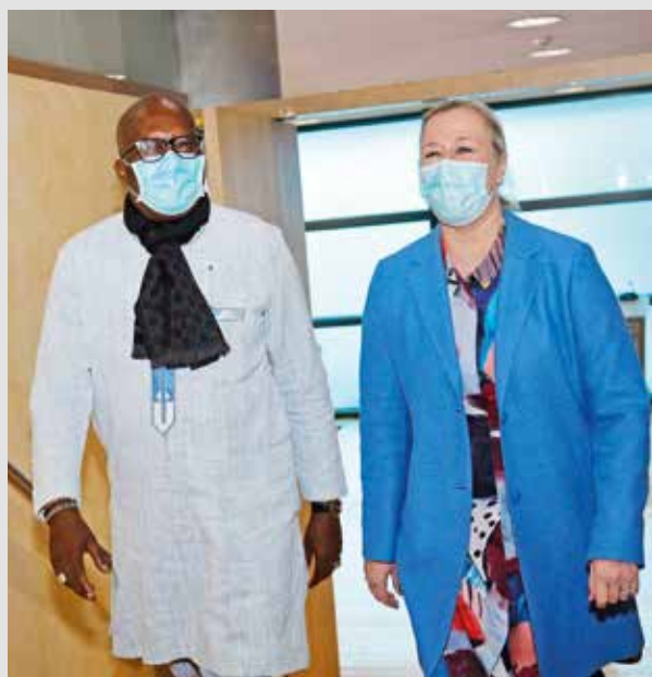
Le chef de l'État a échangé, le 9 février 2021, avec la commissaire européenne chargée des partenariats internationaux, Mme Jutta Urpilainen