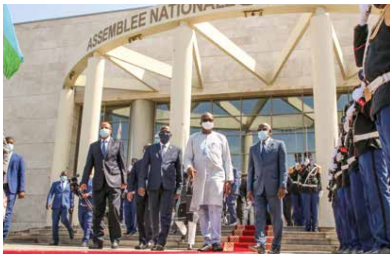
Roch Marc Christian Kaboré a partagé son expérience parlementaire avec les députés djiboutiens

les deux pays. La séance de travail entre les deux chefs d'État le 27 janvier a permis la signature de trois accords de coopération.