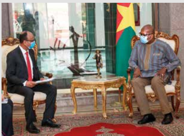
L'ambassadeur d'Égypte, Mibrahim Abdelazim El-Khouli a pour résidence, Ouagadougou