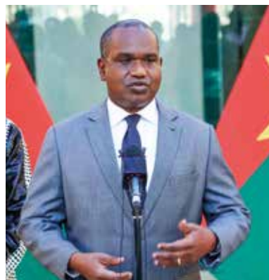
Le ministre Alpha Barry a relevé que l'échéance a été repoussée en ce qui concerne la monnaie unique ECO

Le président du Faso, Roch Marc Christian Kaboré, a participé par visioconférence, le samedi 23 janvier 2021 à Ouagadougou, au 58 e sommet ordinaire de la Conférence des chefs d'État et de Gouvernement, de la Communauté économique des États de l'Afrique de l'Ouest (CEDEAO). A l'issue des travaux, le ministre des Affaires étrangères, de la Coopération, de l'Intégration africaine et des Burkinabè de l'extérieur, Alpha Barry, a fait à la presse le point des grandes décisions de ce sommet.