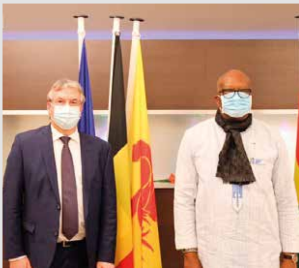
Le 9 février 2021, le président du Faso a rencontré le ministre-président de la Fédération Wallonie-Bruxelles, Pierre Yves Jeholet