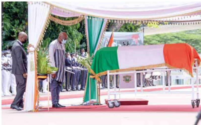
Le président du Faso, Roch Marc Christian Kaboré s'est incliné sur la dépouille de l'illustre disparu.

Décédé le 10 mars 2021 à Fribourg en Allemagne, le Premier ministre Hamed Bakayoko a reçu un hommage solennel national, le mercredi 17 mars 2021, au palais présidentiel. C'était en présence du président du Faso Roch Marc Christian Kaboré, qui a tenu à magnifier l'amitié et la fraternité qui le liaient à l'illustre disparu.