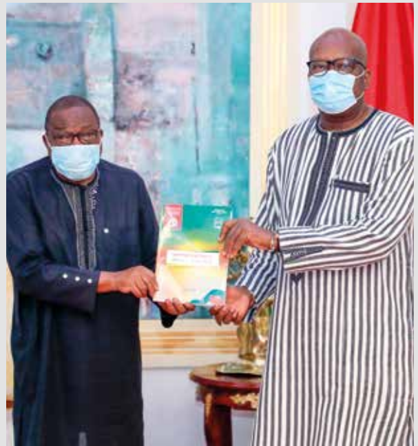
Le président du Faso, Roch Marc Christian Kaboré, a reçu, le 19 avril 2021, le rapport d'activités de la période allant de mai 2019 à avril 2020 du Haut conseil du dialogue social (HCDS)