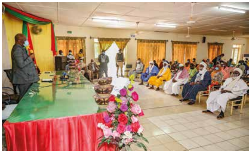
Les forces vives ont été très satisfaites de la visite du président du Faso à Djibo et se disent prêtes à soutenir le gouvernement dans la recherche de solutions à leurs problèmes