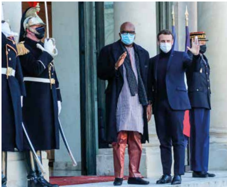
Le président du Faso, Roch Marc Christian Kaboré accueilli à l'Élysée par son homologue français, Emmanuel Macron

Le président du Faso, Roch Marc Christian Kaboré, a effectué, le 9 février 2021 une visite d'amitié et de travail à Paris en France où il a eu un entretien avec le président français Emmanuel Macron. A l'issue de l'entretien entre les deux chefs d'État, le ministre Alpha Barry a fait le point de la rencontre.