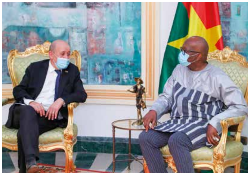
Roch Marc Christian Kaboré a échangé avec Jean-Yves Le Drian sur des sujets relatifs à la sécurité

Le président du Faso, Roch Marc Christian Kaboré, a accordé une audience au ministre français de l'Europe et des Affaires étrangères, Jean-Yves Le Drian, le vendredi 8 janvier 2021, au palais présidentiel. La France, par la voix de son ministre, a félicité le président Kaboré pour sa réélection et salué « l'ancrage démocratique exemplaire » du Burkina Faso.