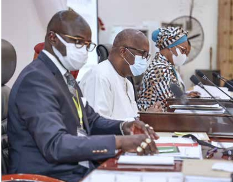
Le président du Faso a invité le conseil à œuvrer pour l'amorce de la fin de la pandémie

Le président du Faso, Roch Marc Christian Kaboré, président du Conseil national de lutte contre le Sida et les Infections sexuellement transmissibles (CNLS-IST), a participé, le vendredi 19 mars 2021 au palais présidentiel, aux travaux de la 19 e session de la structure. Les membres du conseil ont examiné et adopté le nouveau référentiel de lutte contre le Sida 2021-2025, avec l'exigence « d'amorcer la fin de la pandémie ».